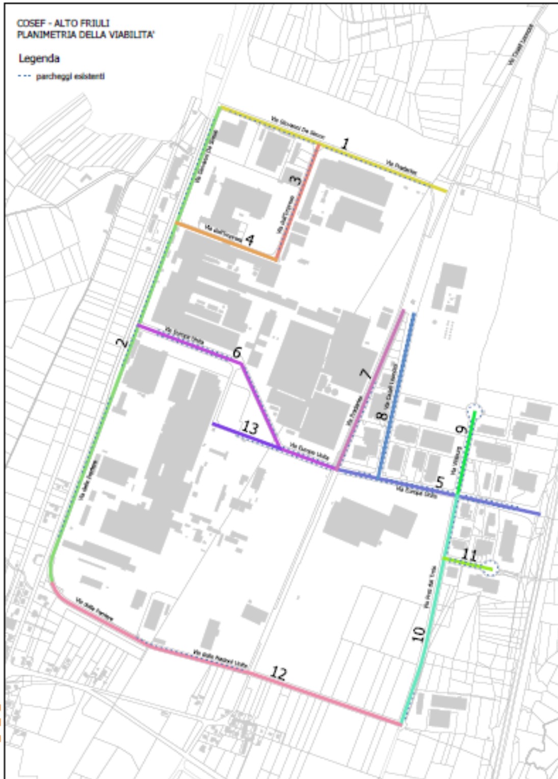
viabilità in area alto Friuli (ex CIPAF)